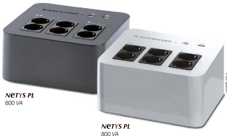
NeTYS PL 600 VA